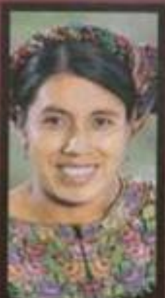
EVA CAPACITA A COMADRONAS ANTE RIESGOS