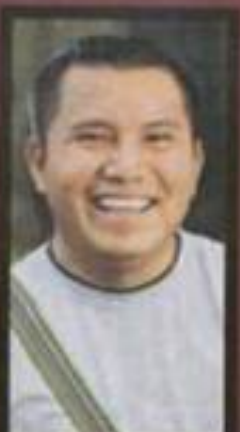
JACINTO Y LA ESCUELA DE ENFERMERÍA