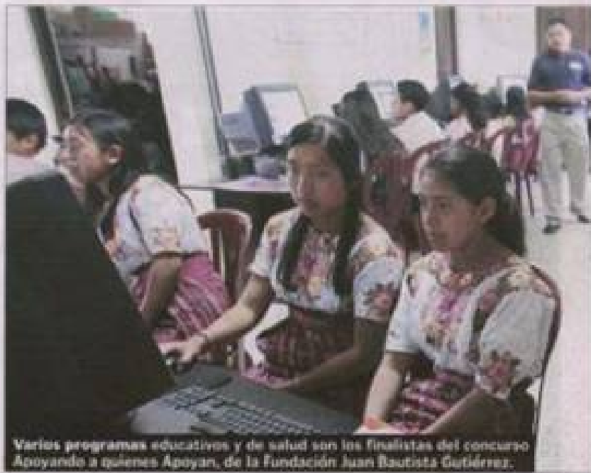
Varios programas educativos y de salud son los finalistas del concurso Apoyando a quienes Apoyan, de la Fundación Juan Bautista Gutiérrez.

Amigas capacita a comadronas en temas de derechos humanos y en prevención de violencia contra la mujer.