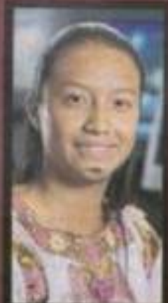
BRENDA LE DA OPORTUNIDAD A ESTUDIANTES