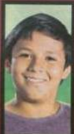
MOISÉS TIENDE LA MANO A LOS JÓVENES